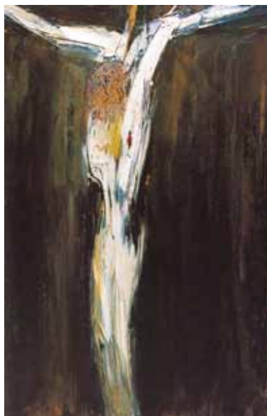
Przykład współczesnej sztuki religijnej. Ukrzyżowany (numer 2), W. Congdon

za wszystko za wszystko dziękuję za spokój i trwogę za to, że nie rozumiem i odejść nie mogę za to, że nas łączą niepoznane ręce za jedną jeszcze jesień, by pokochać więcej uratuje, otworzy parasol nade mną posłuszeństwo, co prowadzi w ciemność (ks. Jan Twardowski, z tomu Czas bez pożegnań )